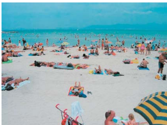
Platja de Palma