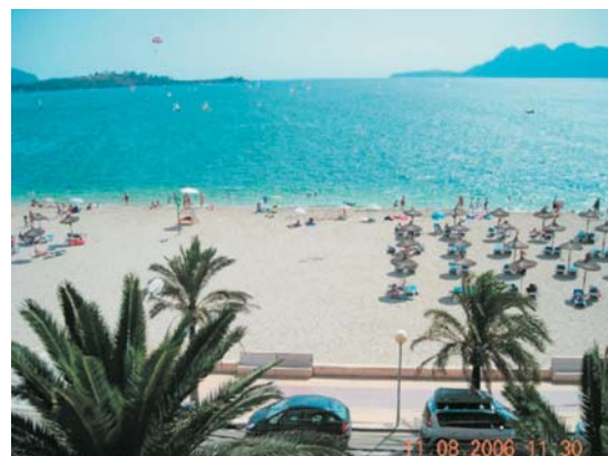
Port de Pollença