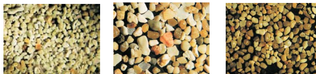
Tipus de gra