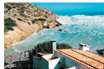
Imágenes de la Cala San Vicenç con diferentes condiciones de oleaje