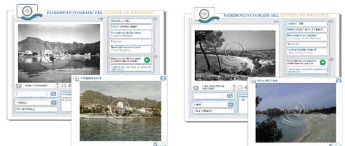
Exemple de la proposta del portal Patrimoni fotogràfic del litoral de Mallorca