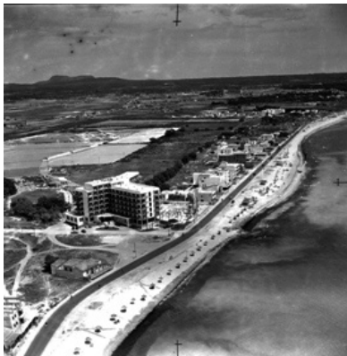
Can Pastilla a la dècada dels 60.