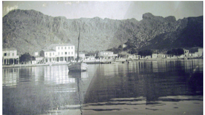
Port de Pollença, 1915.